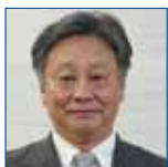
2ZZC 花房 博夫 吹田江坂 LC