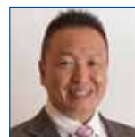
2ZZC 中庄谷 栄孝 泉佐野中央 LC