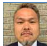
11R 北口 勝進 東大阪大東堺 LC