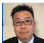
9R 島 束穂 和歌山中央 LC