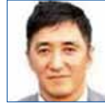
5R 中 保博 箕面 LC