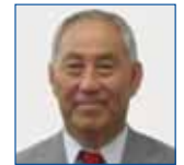
9R 芝 吉信 和歌山中央 LC