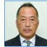
2ZZC 西 太吉 勝浦 LC