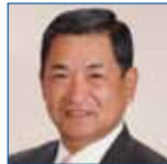
9R 溝北 好一