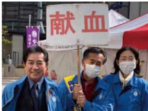
3.15 守口 LC 献血アクティビティ