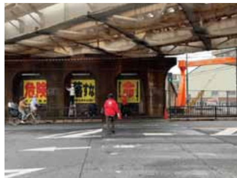
3.29 堺泉北 LC 落書き消しアクティビティ