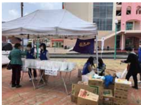
4.4 紀伊田辺 LC 献血アクティビティ