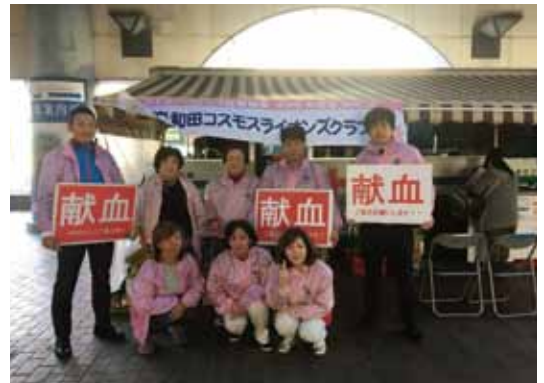
第1回献血アクティビティ (2019年11月20日(水)於：南海岸和田駅前)

若手の集まりです。主なアクティビティは岸和田コスモス LC と共に、薬物乱用防止教室に参加、配役担当して頂いています。なかなか、迫真の演技です。献血にも参加して頂いており、受付・採血もしています。