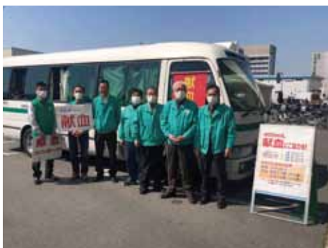
3.19 東大阪 LC 献血アクティビティ