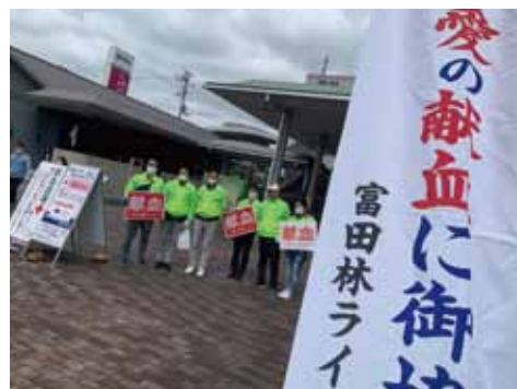
3.29 富田林 LC 献血アクティビティ