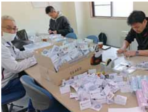
4.6 堺登美丘 LC 缶バッジ配布アクティビティ